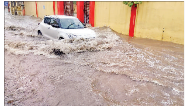
बरसात के बाद रामलीला ग्राउंड के सामने बादशाही रोड पूरी तरह से जलमग्न।