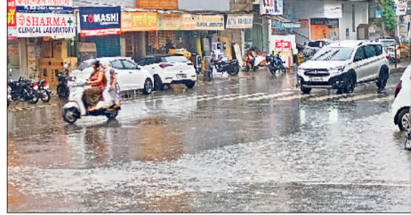
सोनीपत। शहर में हुई बारिश में गुजरते वाहन चालक।