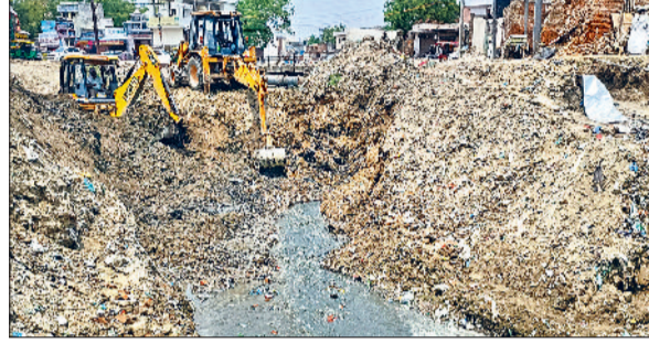
सोनीपत। ड्रेन को जेसीबी की मदद से खोलते हुए कर्मचारी।