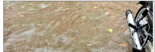
इतना पानी खड़ा रहता है कि एक या दो दिन उनकी दुकानदारी प्रभावित रहती है। अब तो हालत पहले से भी बर्बर हो गई है। बरसात होने के कुछ घंटे बाद नालों से रेलवे रोड का पानी उतर जाता था, लेकिन शनिवार को सुबह हुई बरसात का