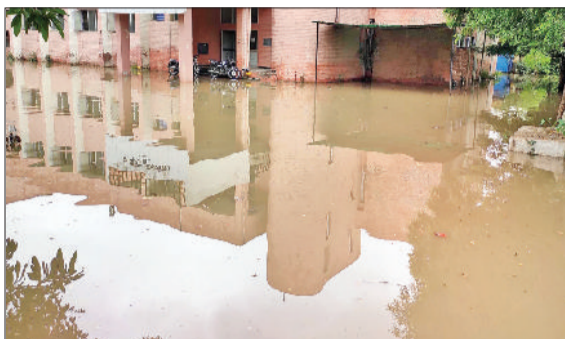
गन्नौर। पुराना एसडीएम कार्यालय के परिसर में भरा बरसात का पानी।