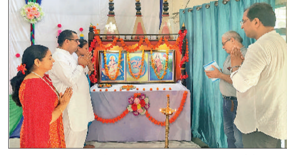
कार्यशाला का शुभारंभ करते अतिथि एवं शिक्षकगण।