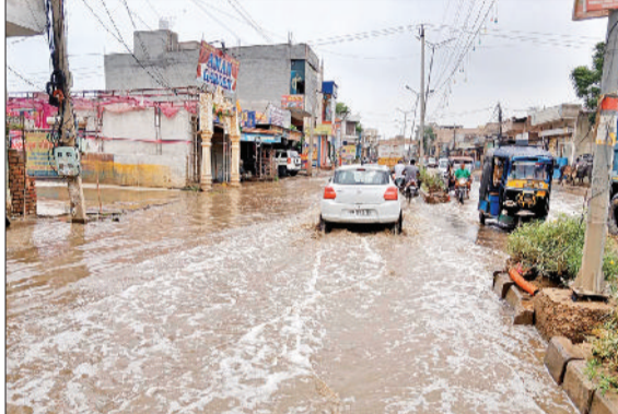
दोपहर को हुई बरसात के बाद शाम को रेलवे रोड पर भरा बरसात का पानी।

सरकारी भवन में जलमग्न बरसात के कारण सरकारी भवनों के बाहर भी पानी जमा हो गया। पुराना तहसील परिसर, जनस्वास्थ्य विभाग व नया कार्यालयों के परिसर भी पूरी तरह जलमग्न हो गया। पानी पूरा दिन सड़क पर भरा रहा।