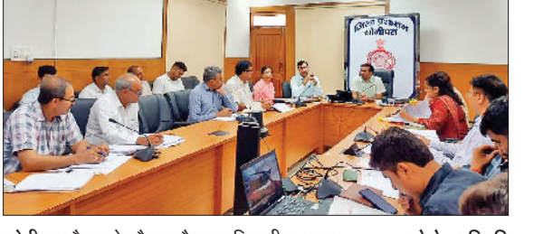
सोनीपत। बैठक के दौरान मौजूद अधिकारी व अन्य।

मुख्यमंत्री घोषणाओं व अन्य योजनाओं के तहत गांव में किए जा रहे विकास कार्यों की गंभीरता से लेते संबंधित अधिकारी प्राथमिकता के साथ पूरा करवाएं ताकि ग्रामीणों को सभी सुविधाएं मिल सकें। उन्होंने कहा कि अगर किसी कार्यों को करवाने में किसी अधिकारी को कोई परेशानी आ रही है तो उस समस्या को दूर करने के लिए जिला प्रशासन का पूर्ण सहयोग मिलेगा। उन्होंने कहा कि