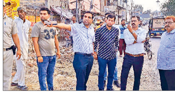
सोनीपत। मौके पर दिशा-निर्देश देते हुए उपायुक्त।

ड्रेन का पानी जाहरी गांव तक पहुंचा, उपायुक्त ने मौके का दौरा कर ड्रेन को खुलवाया